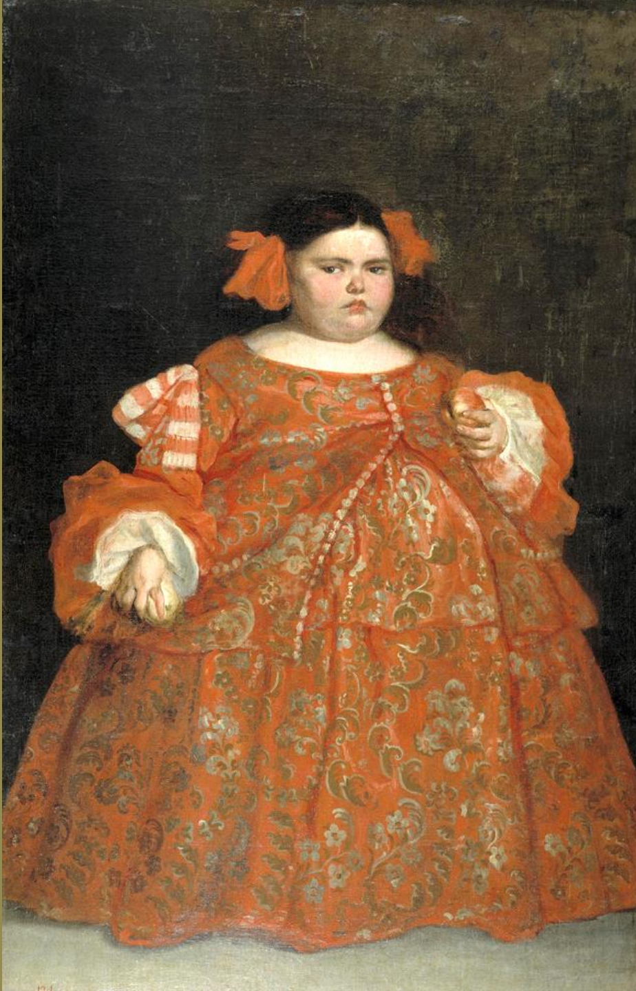
Juan Carreno de Miranda (Avilès, 1614 – Madrid, 1685), Eugenia Martinez Vallejo , vers 1680, peinture à l'huile sur toile, Madrid, musée du Prado.