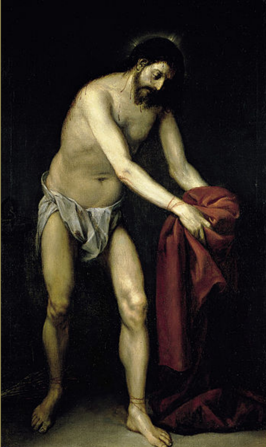
Alonso Cano (Grenade, 1601 – Grenade, 1667), Le Christ se dépouille de ses vêtements, vers 1646, peinture à l'huile sur toile, Madrid, Real Academia de San Fernando.