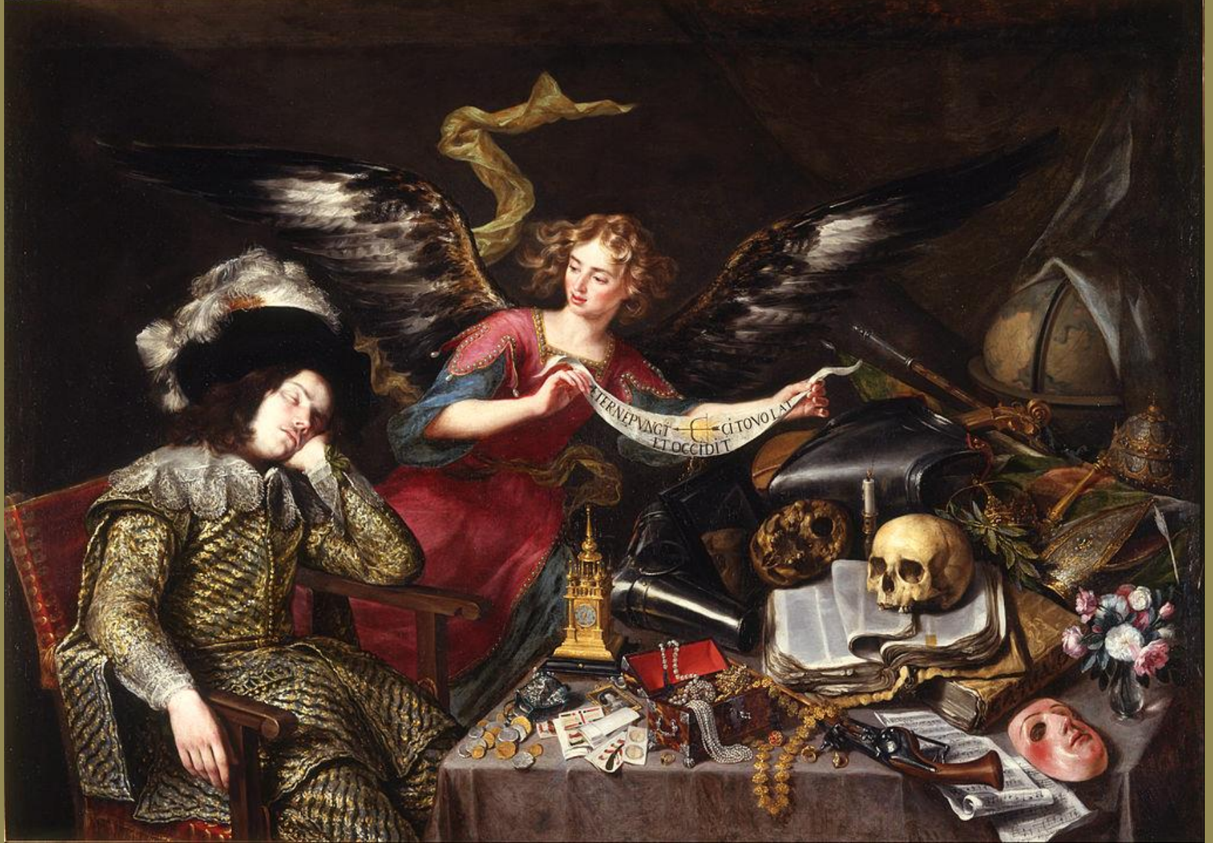
Francisco Collantes (Madrid, 1599 – Madrid, 1656), Le Songe du soldat , vers 1650, peinture à l'huile sur toile, Madrid, Real Academia de San Fernando.