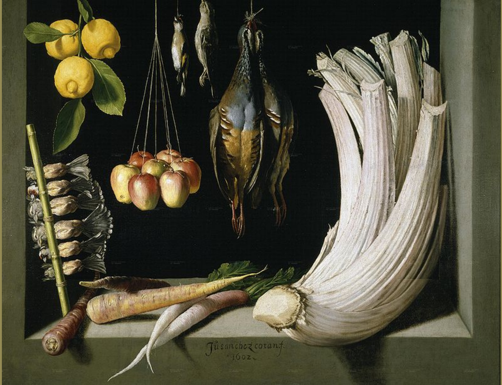
Juan Sanchez Cotan (Orgaz, 1560 – Grenade, 1627).