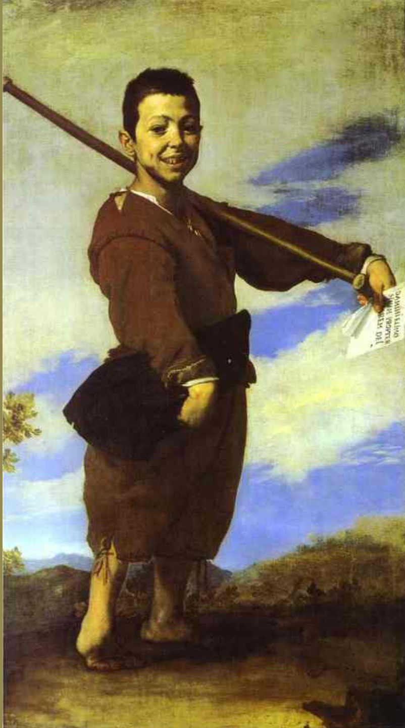
Jusepe de Ribera (Jativa, 1591 – Valence, 1652), Le Pied-bot, 1642, peinture à l'huile sur toile, Paris, musée du Louvre.