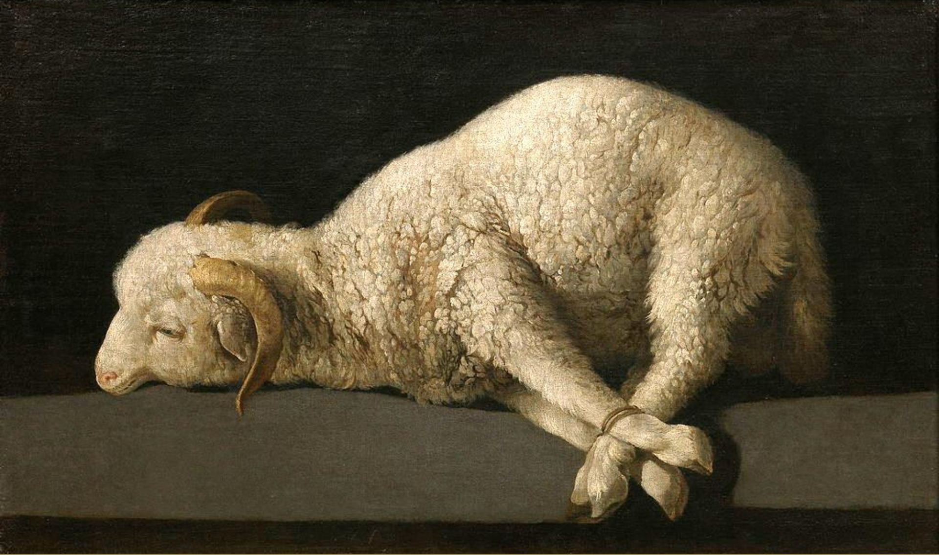
Francisco de Zurbaran (Fuente de Cantos, 1598 – Madrid, 1664).