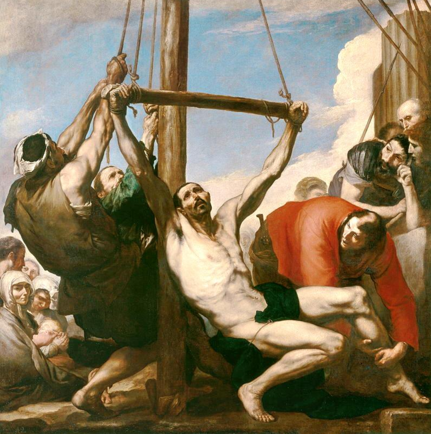
Jusepe de Ribera (Jativa, 1591 – Valence, 1652), Le Martyre de saint Philippe , 1639, peinture à l'huile sur toile, Madrid, musée du Prado.