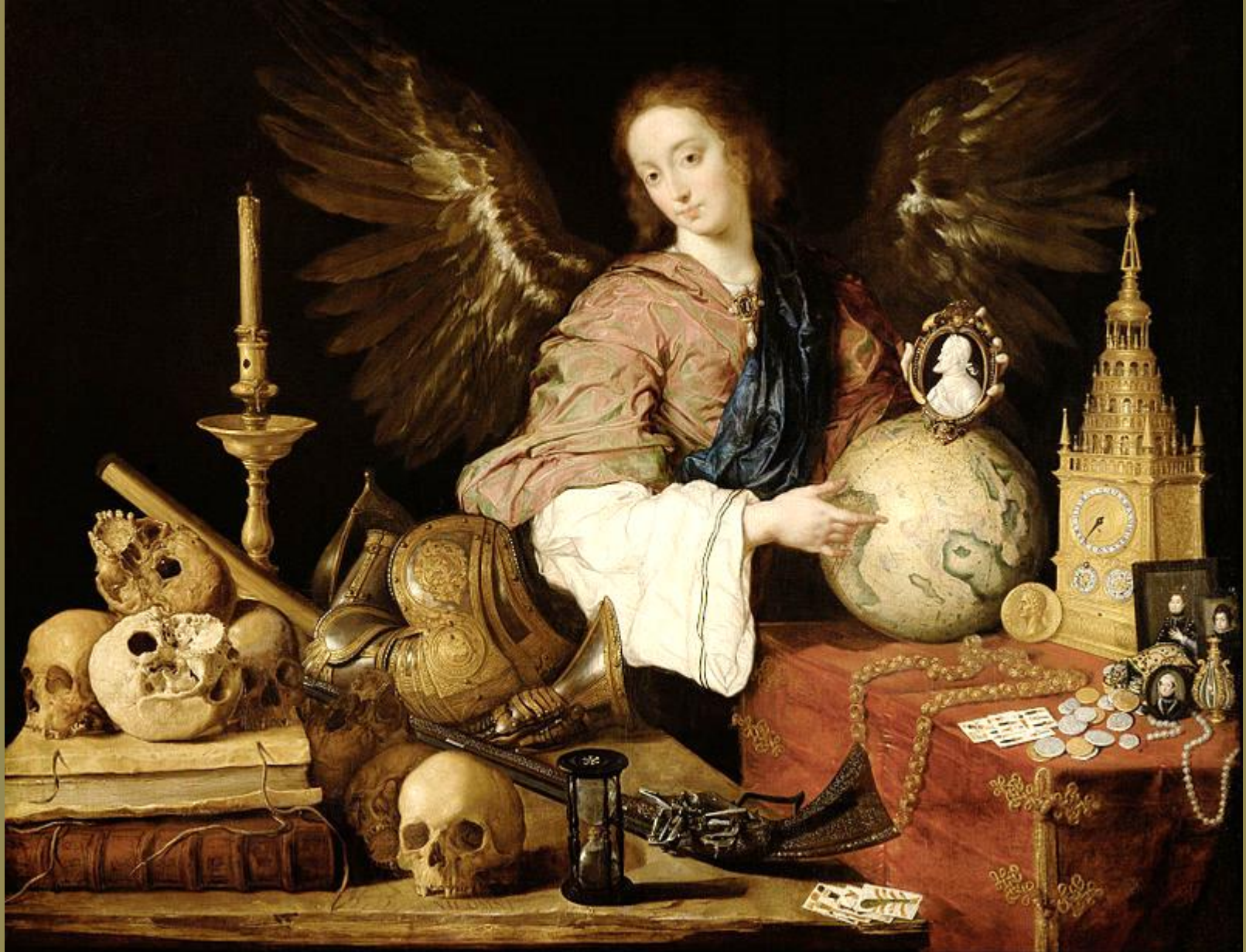
Antonio de Pereda (Valladolid, 1611 – Séville, 1678), Allégorie de la Vanitas , 1632/6, peinture à l'huile sur toile, Vienne, Kunsthistorisches Museum.