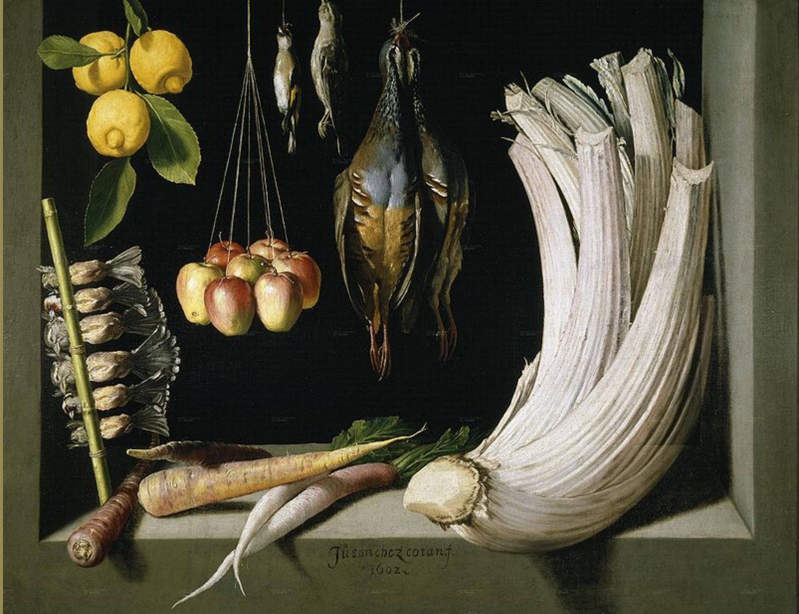
Juan Sanchez Cotan (Orgaz, 1560 – Grenade, 1627), Nature morte , 1602, peinture à l'huile sur toile, Madrid, musée du Prado.