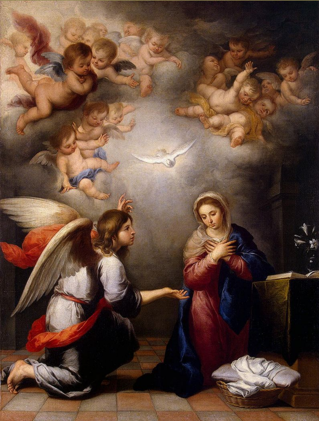
Bartolomé Esteban Murillo (Séville, 1618 – Séville, 1682), L'Annonciation, vers 1660, peinture à l'huile sur toile, Saint-Pétersbourg, musée de l'Ermitage.