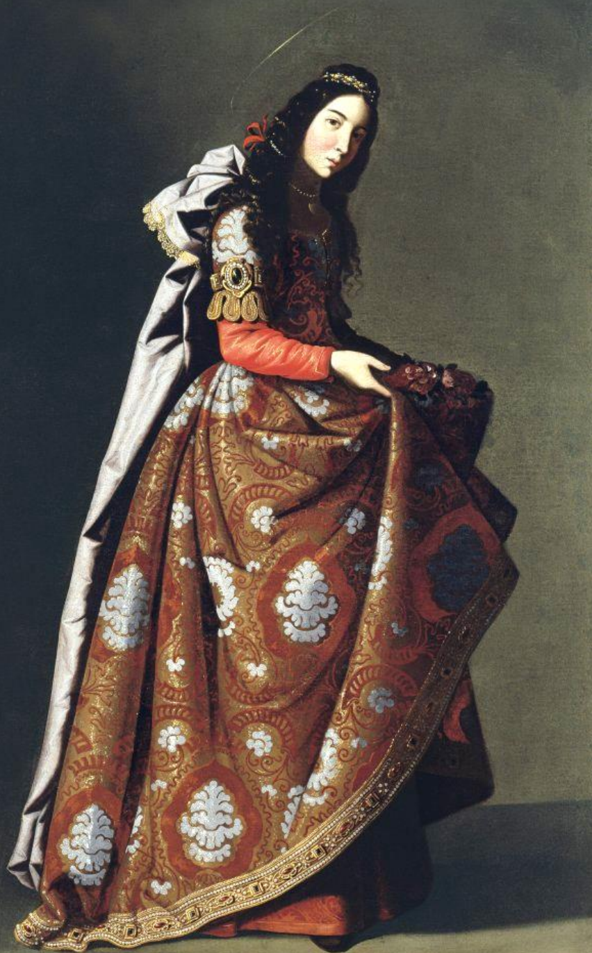
Francisco de Zurbarán (Fuente de Cantos, 1598 – Madrid, 1664), Sainte Casilda, 1630/5, peinture à l'huile sur toile, Madrid, musée Thyssen-Bornemisza.