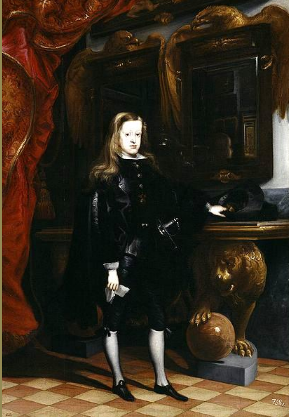
Juan Carreno de Miranda (Avilès, 1614 – Madrid, 1685).