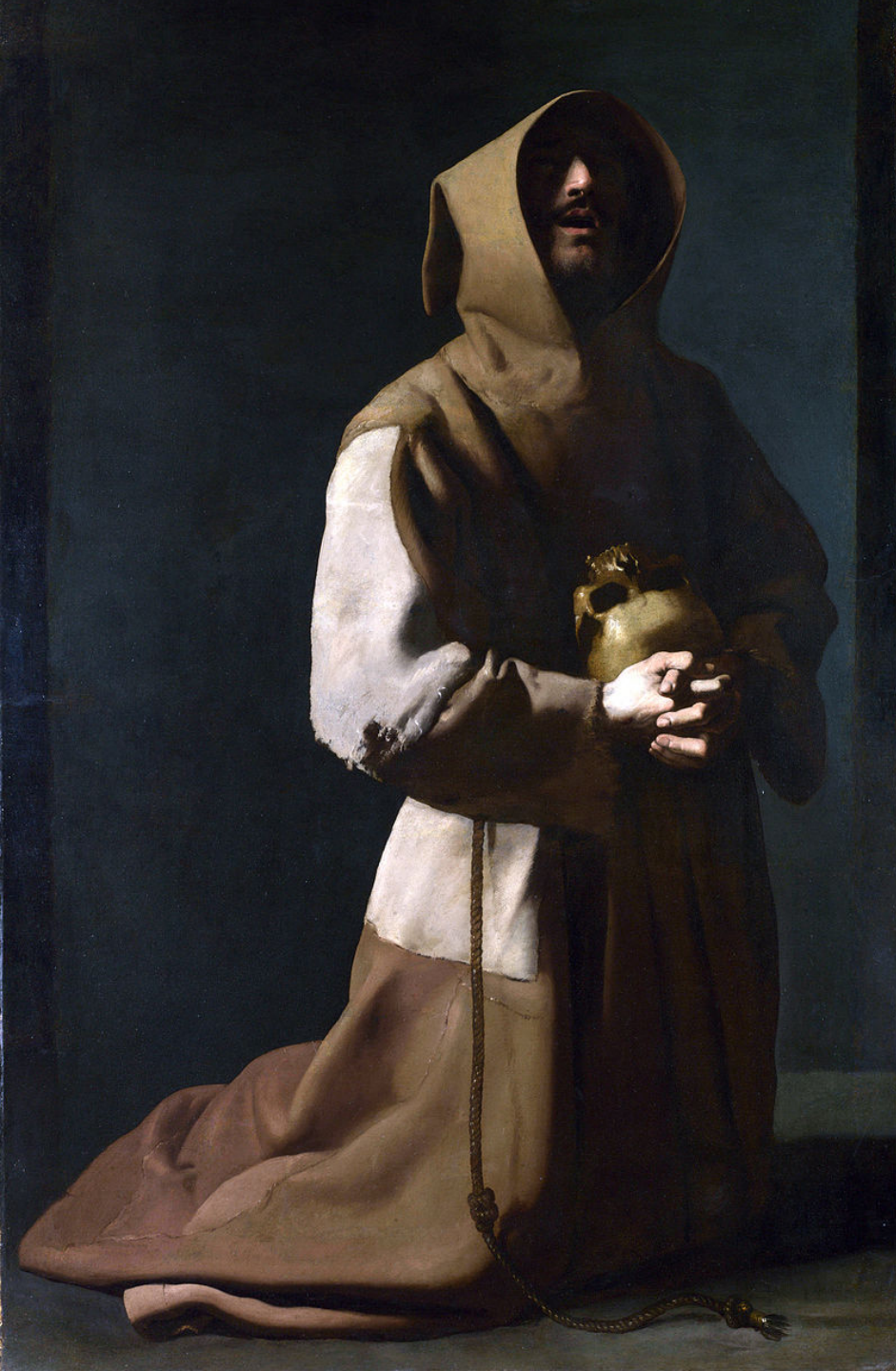
Francisco de Zurbarán (Fuente de Cantos, 1598 – Madrid, 1664), Saint François en méditation, 1635/9, peinture à l'huile sur toile, Londres, National Gallery.