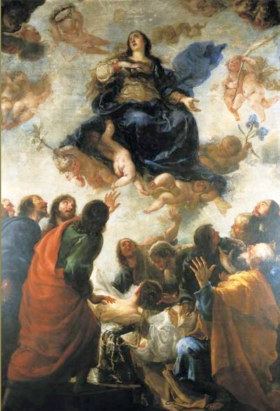
Juan Carreno de Miranda (Avilès, 1614 – Madrid, 1685), L'Assomption , vers 1665, peinture à l'huile sur toile, Poznan, musée national.