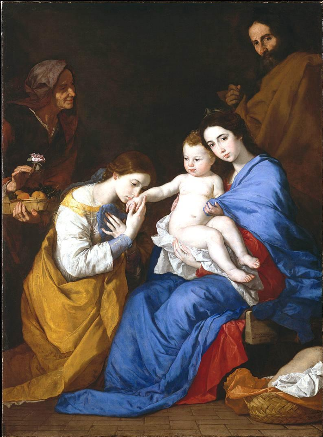
Jusepe de Ribera (Jativa, 1591 – Valence, 1652), Le Mariage mystique de sainte Catherine , 1648, peinture à l'huile sur toile, New York, The Metropolitan Museum of Art.