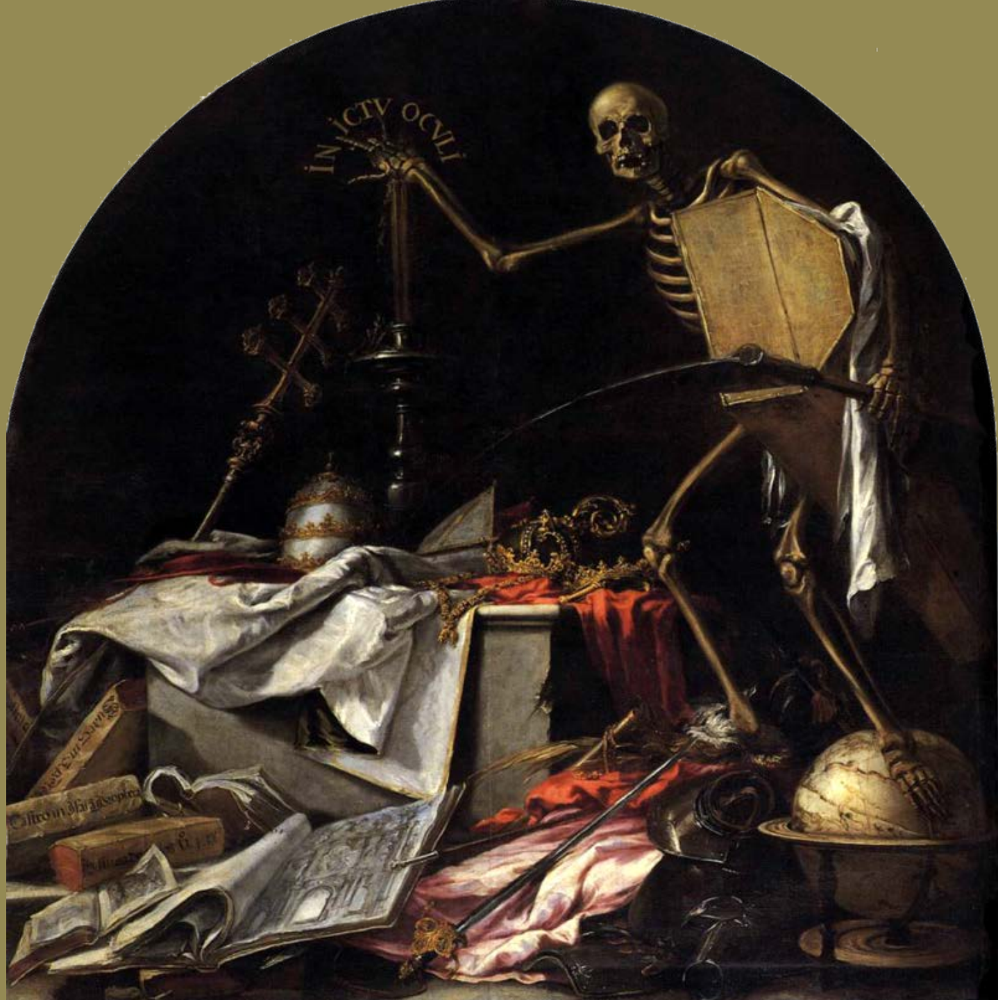
Juan de Valdés Leal (Séville, 1622 – Séville, 1690), In Ictu Oculi , 1670/2, peinture à l'huile sur toile, Séville, Hôpital de la Charité.