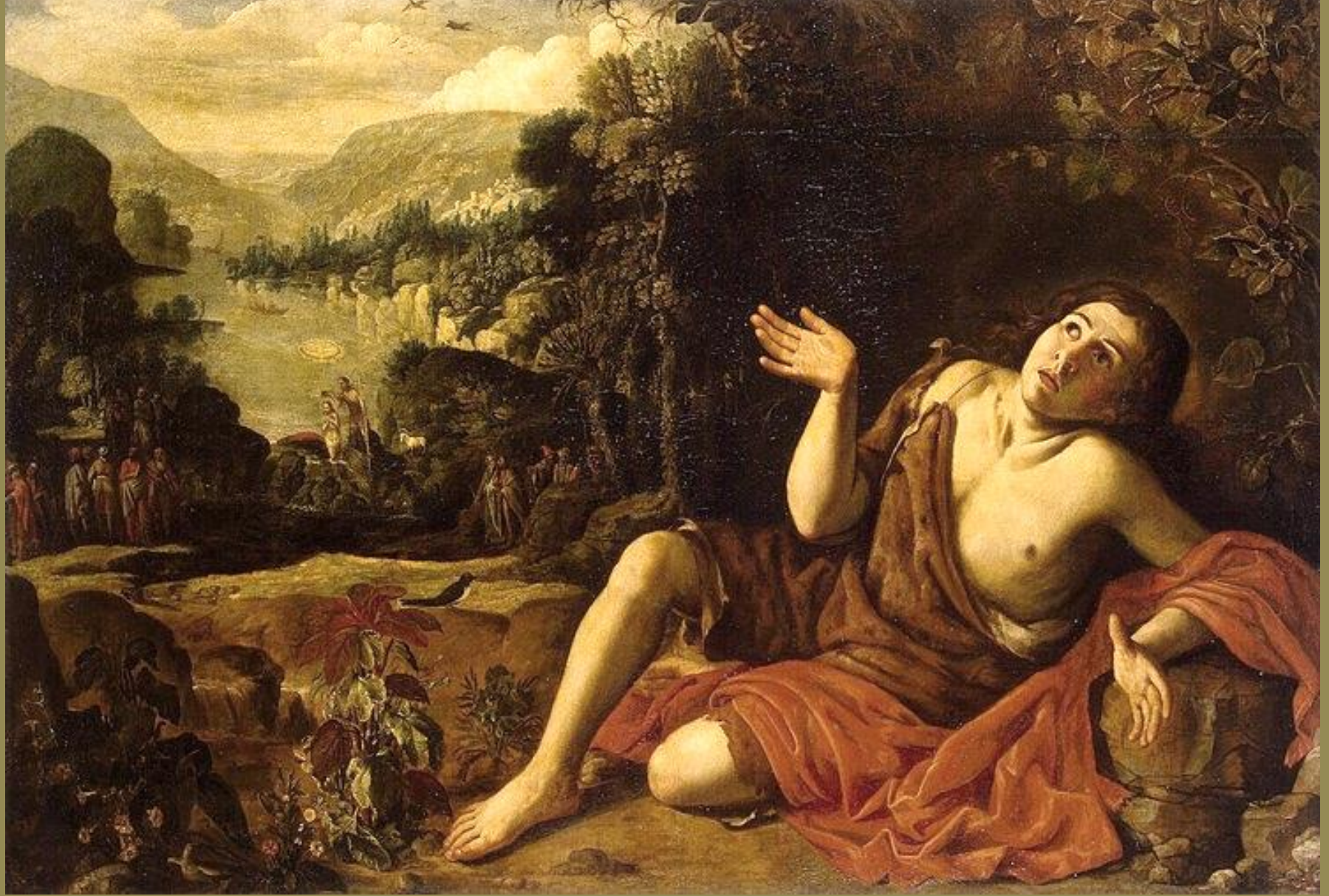
Francisco Collantes (Madrid, 1599 – Madrid, 1656), Saint Jean Baptiste au désert vers 1629/30, peinture à l'huile sur toile, Saint-Pétersbourg, musée de l'Ermitage.