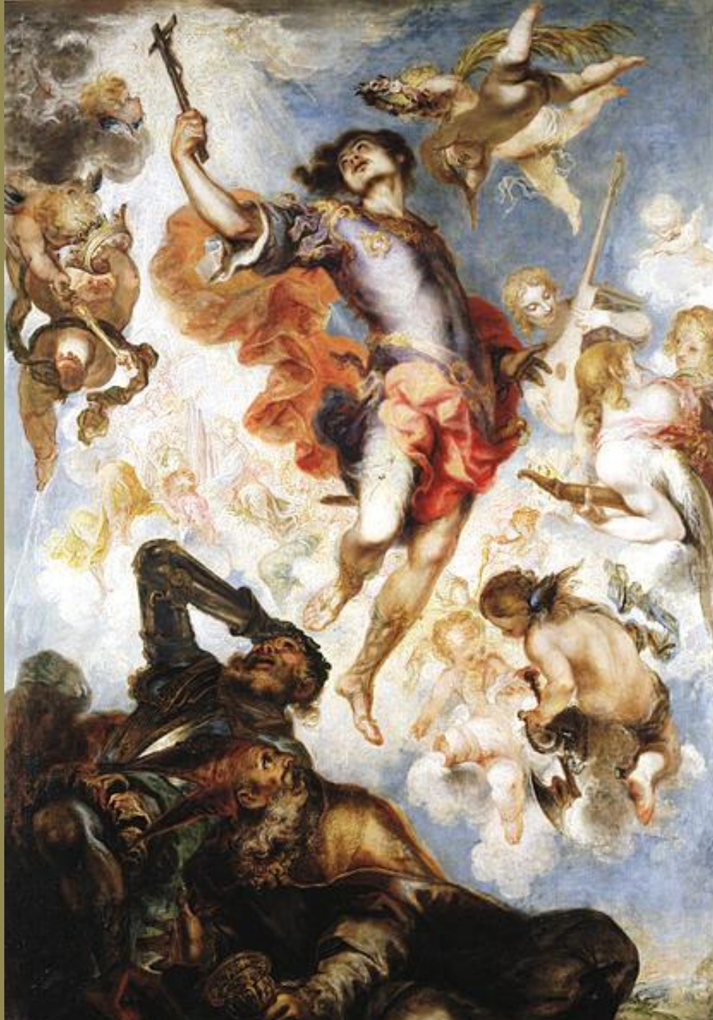
Francisco de Herrera, dit le Jeune (Séville, 1627 – Madrid, 1685).