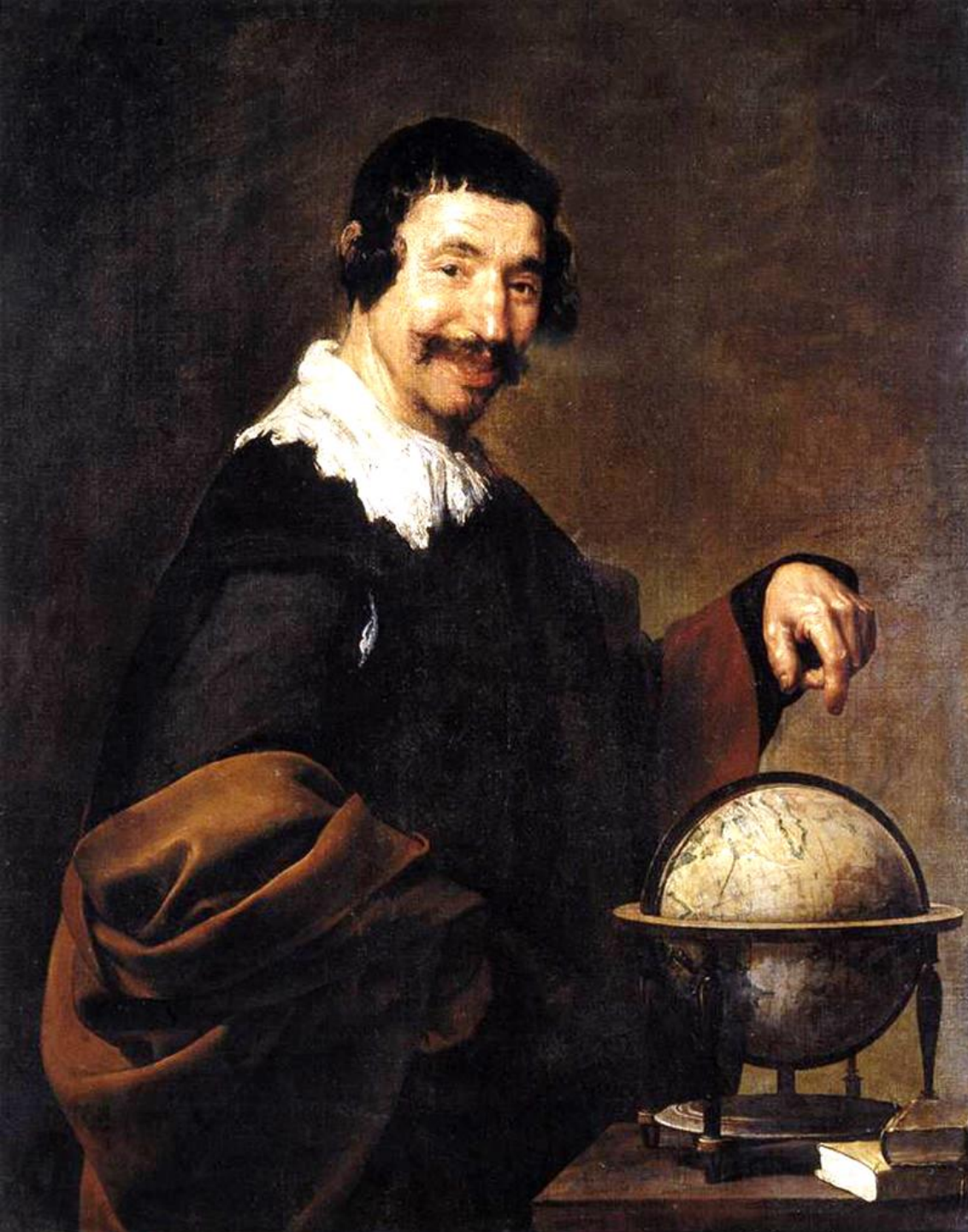
Diego Velázquez (Séville, 1599 – Madrid, 1660), Démocrite , 1639/40, peinture à l'huile sur toile, Rouen, musée des Beaux-Arts.