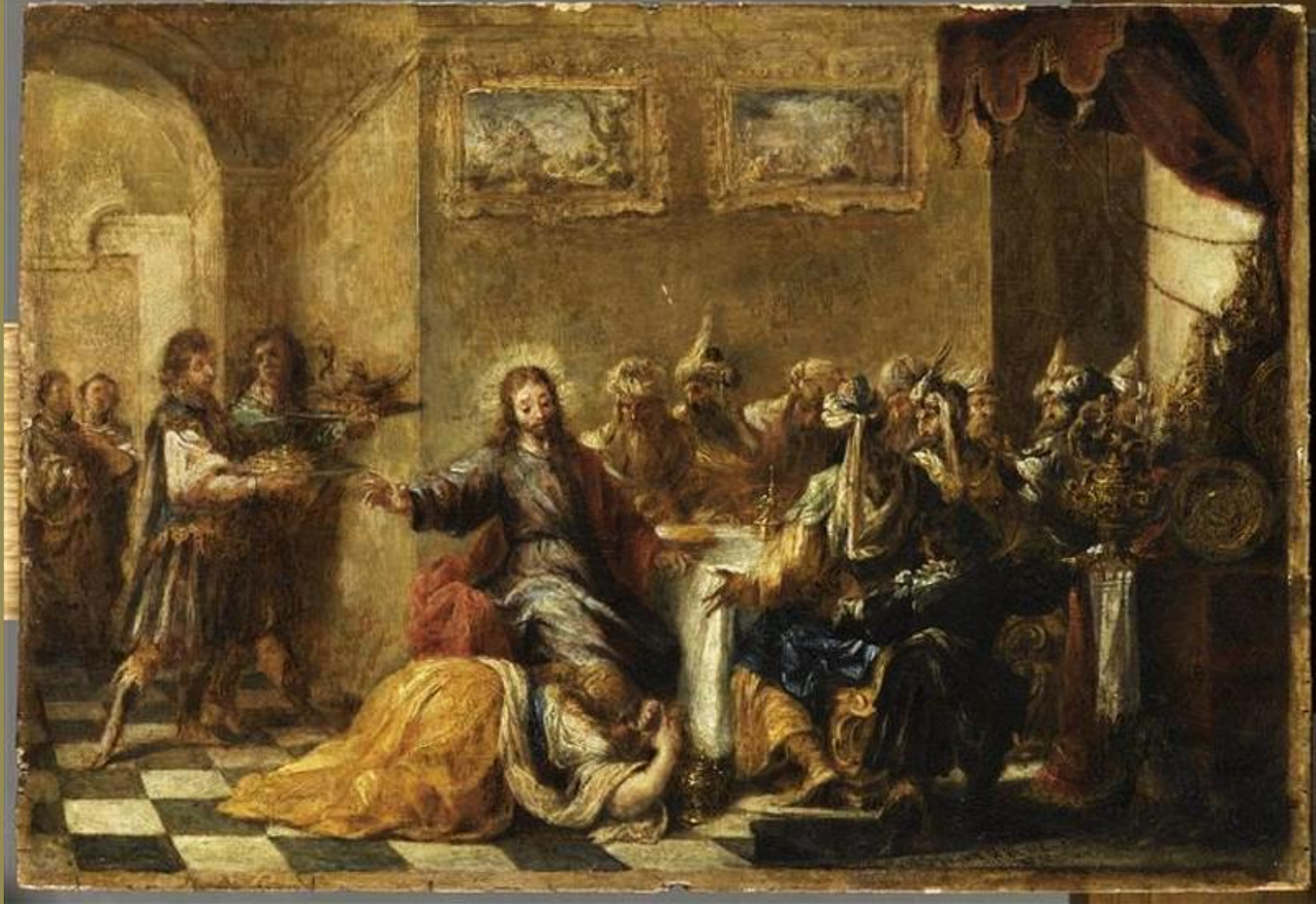
Juan de Valdés Leal (Séville, 1622 – Séville, 1690), Le Repas chez Simon , 1660, peinture à l'huile sur toile, Paris, musée du Louvre.