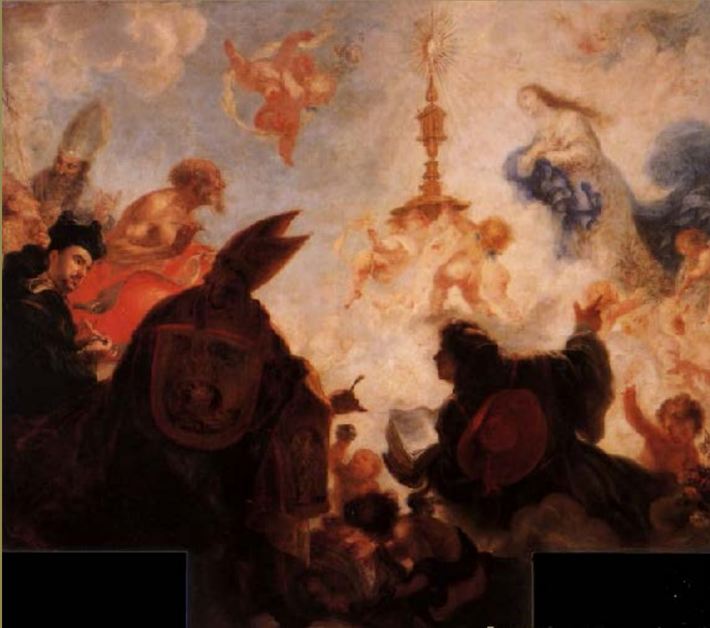
Francisco de Herrera, dit le Jeune (Séville, 1627 – Madrid, 1685), L'Apothéose de l'Eucharistie , 1656, peinture à l'huile sur toile, Séville, cathédrale.