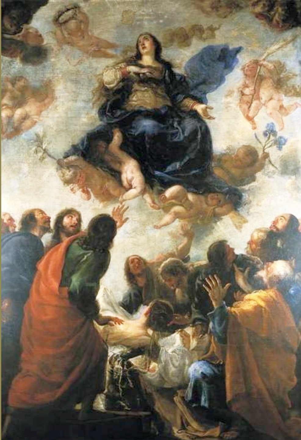
Juan Carreno de Miranda (Avilès, 1614 – Madrid, 1685).