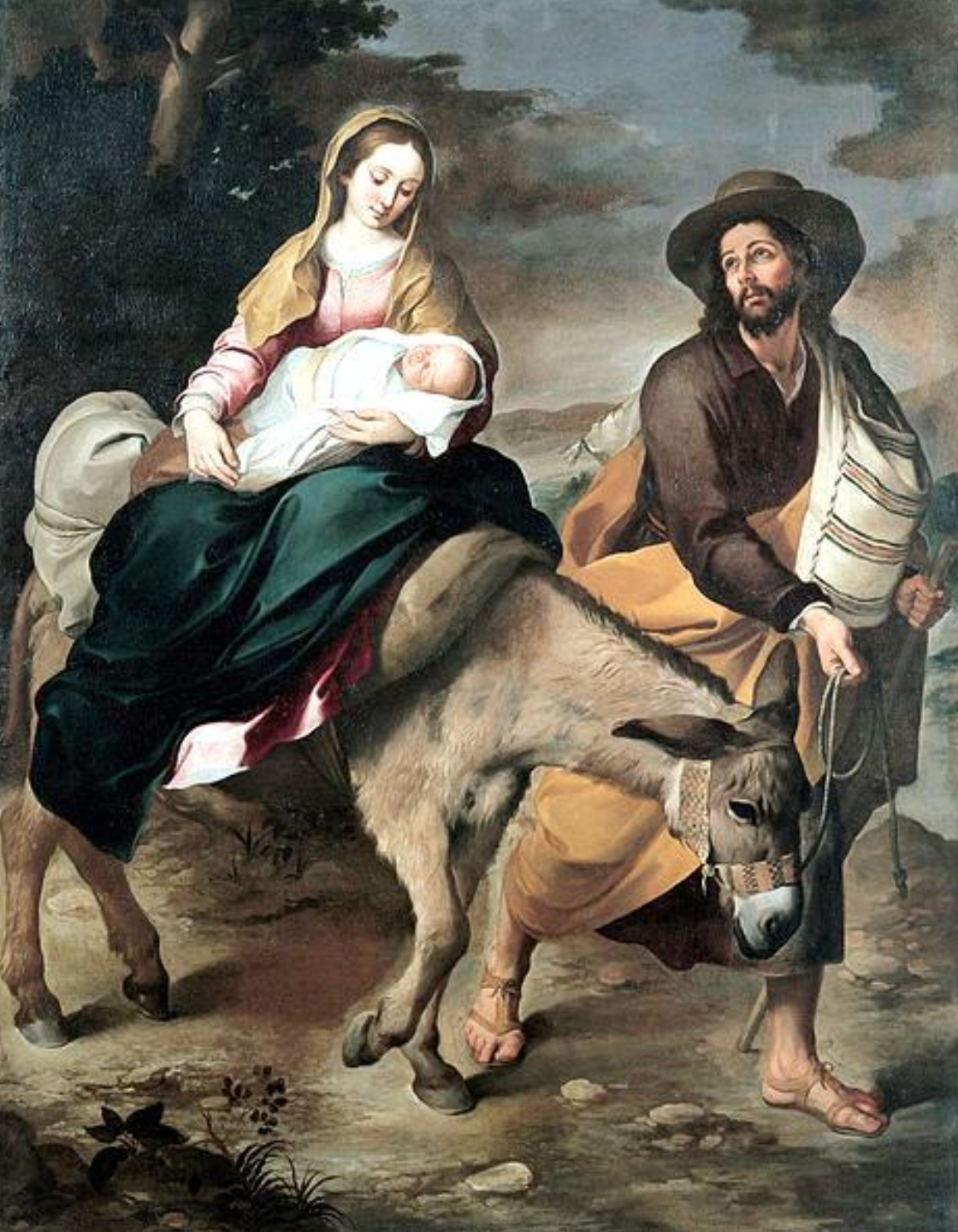
Bartolomé Esteban Murillo ( Séville, 1618 – Séville, 1682 ), La Fuite en Egypte , 1645/50, peinture à l'huile sur toile, Gênes, Musei di Strada Nuova.