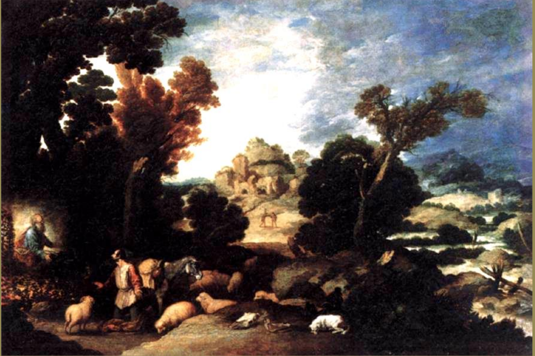
Francisco Collantes (Madrid, 1599 – Madrid, 1656), Moïse et le buisson ardent , vers 1634, peinture à l'huile sur toile, Paris, musée du Louvre.