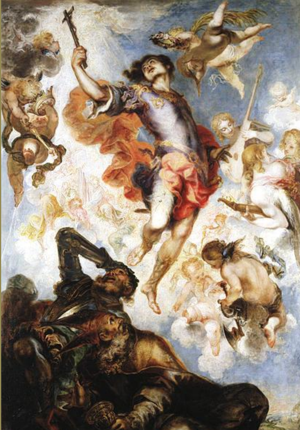
Francisco de Herrera, dit le Jeune (Séville, 1627 – Madrid, 1685), Le Triomphe de saint Herménégilde , 1654, peinture à l'huile sur toile, Madrid, musée du Prado.