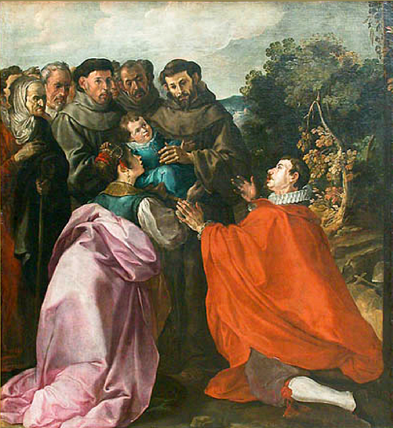
Francisco de Herrera, dit le Vieux (Séville, vers 1585 – Madrid, 1654), La Guérison de saint Bonaventure enfant par saint François , 1628, peinture à l'huile sur toile, Paris, musée du Louvre.