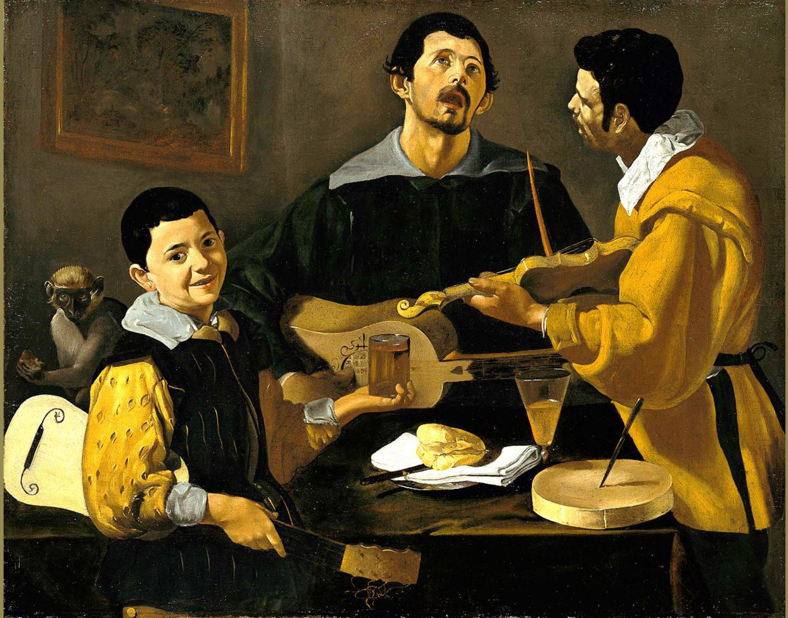
Diego Velazquez (Séville, 1599 – Madrid, 1660), Les Musiciens , 1617/8, peinture à l'huile sur toile, Berlin, Gemäldegalerie.