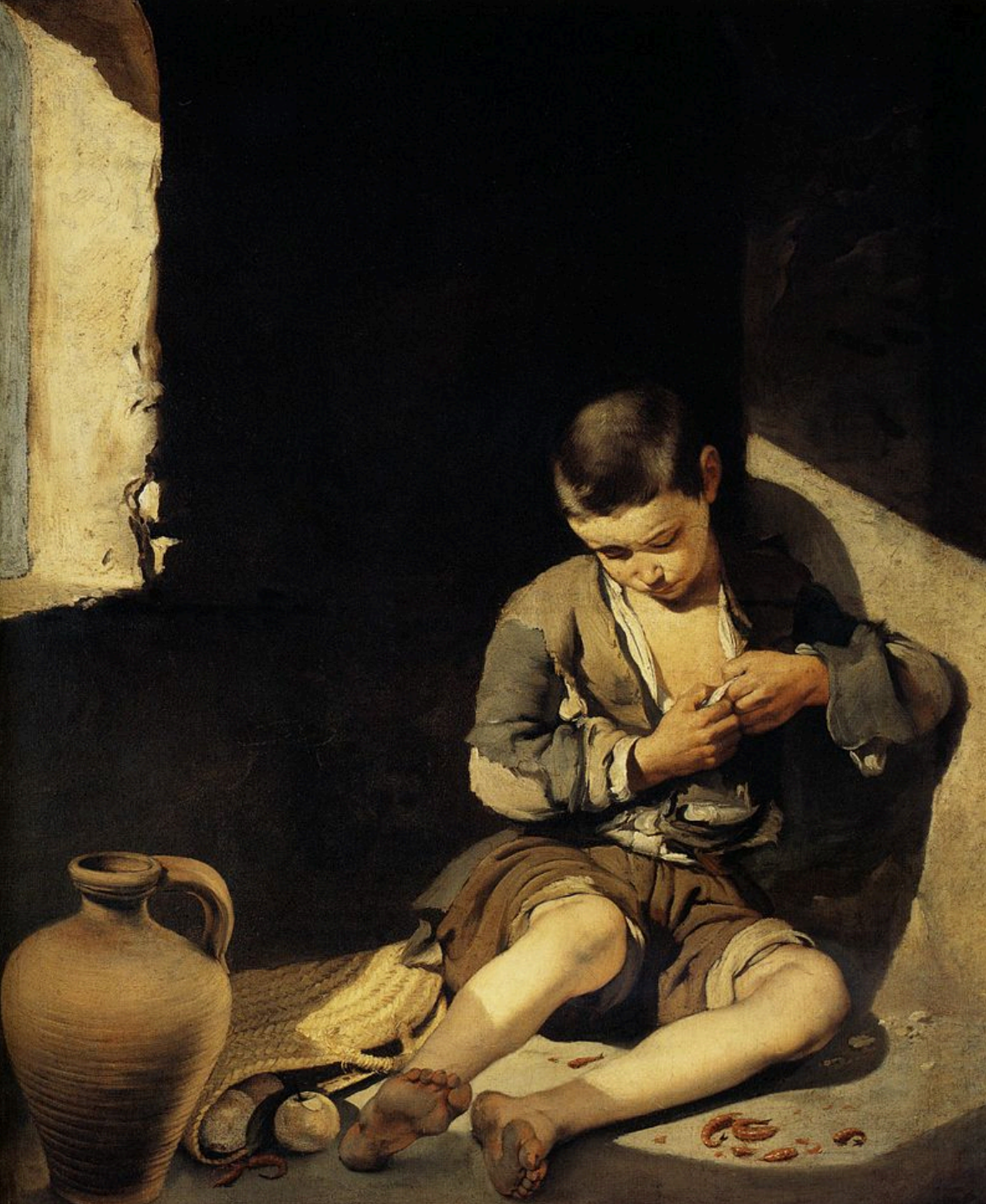
Bartolomé Esteban Murillo (Séville, 1618 – Séville, 1682), Jeune mendiant, vers 1645, peinture à l'huile sur toile, Paris, musée du Louvre.