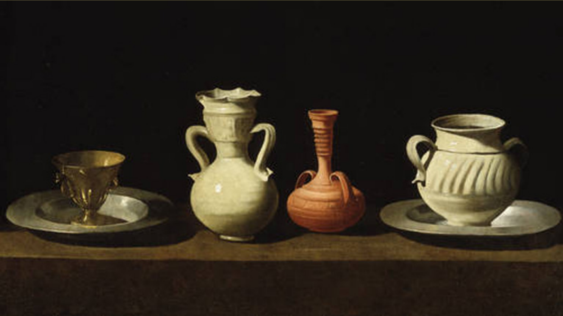
Francisco de Zurbarán (Fuente de Cantos, 1598 – Madrid, 1664), Nature morte de vaisselle , 1650, peinture à l'huile sur toile, Madrid, musée du Prado.