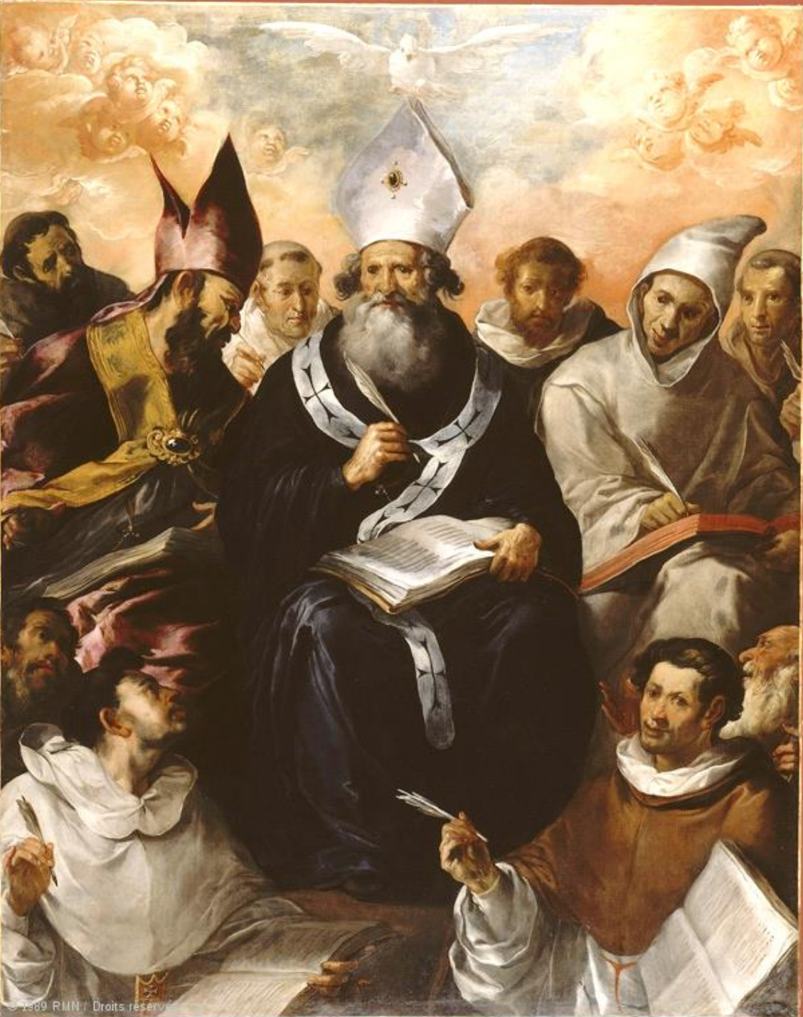
Francisco de Herrera, dit le Vieux (Séville, vers 1585 – Madrid, 1654), Saint Basile dictant sa doctrine , 1637, peinture à l'huile sur toile, Paris, musée du Louvre.