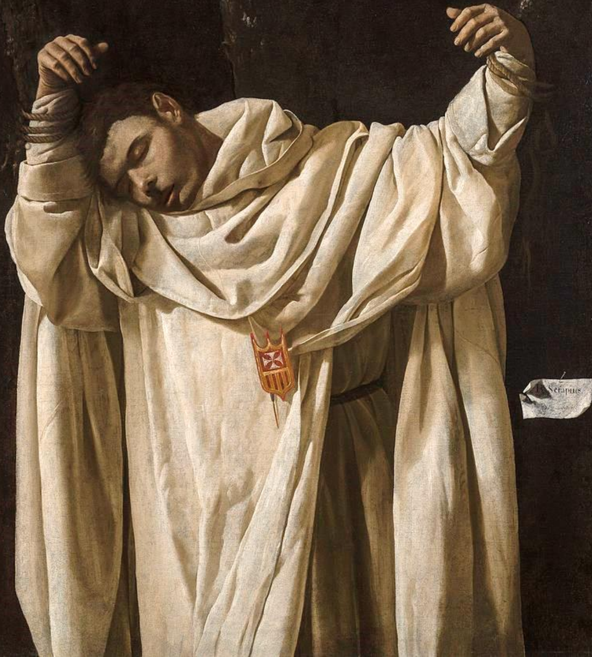
Francisco de Zurbarán (Fuente de Cantos, 1598 – Madrid, 1664), Saint Sérapion, 1628, peinture à l'huile sur toile, Hartford, Wadsworth Atheneum.