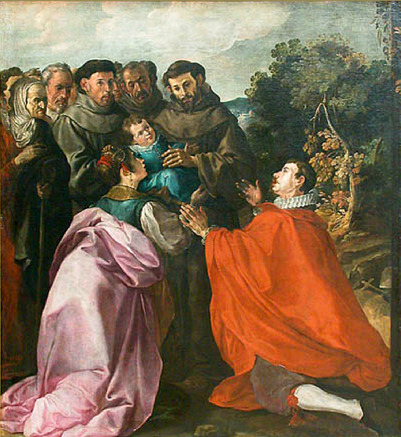
Francisco de Herrera, dit le Vieux (Séville, vers 1585 – Madrid, 1654).