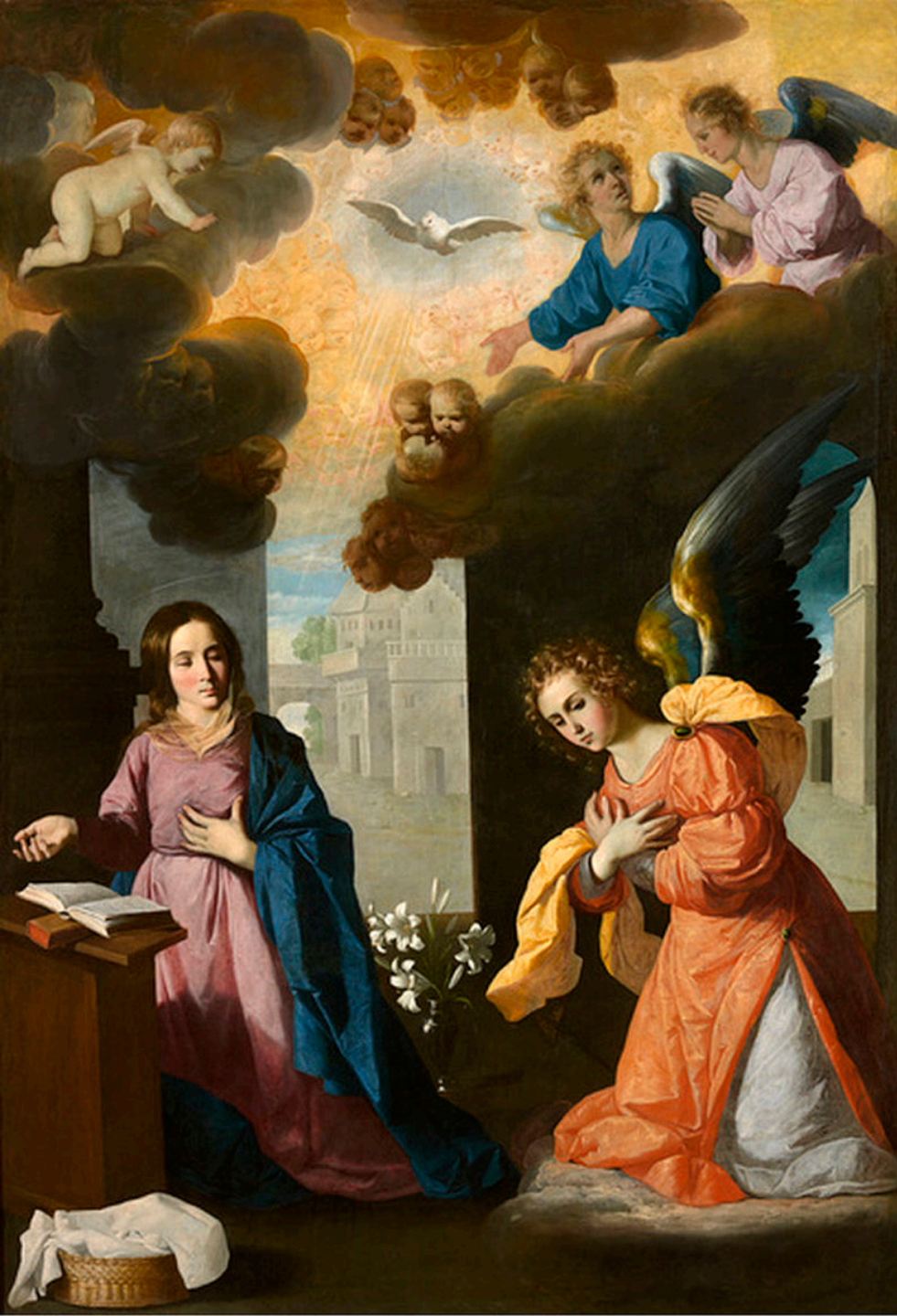
Francisco de Zurbarán (Fuente de Cantos, 1598 – Madrid, 1664), L'Annonciation, 1637/9, peinture à l'huile sur toile, Grenoble, musée.