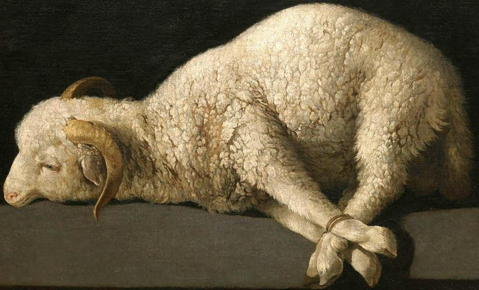
Francisco de Zurbaran (Fuente de Cantos, 1598 – Madrid, 1664), Agnus Dei , 1635/40, peinture à l'huile sur toile, Madrid, musée du Prado.