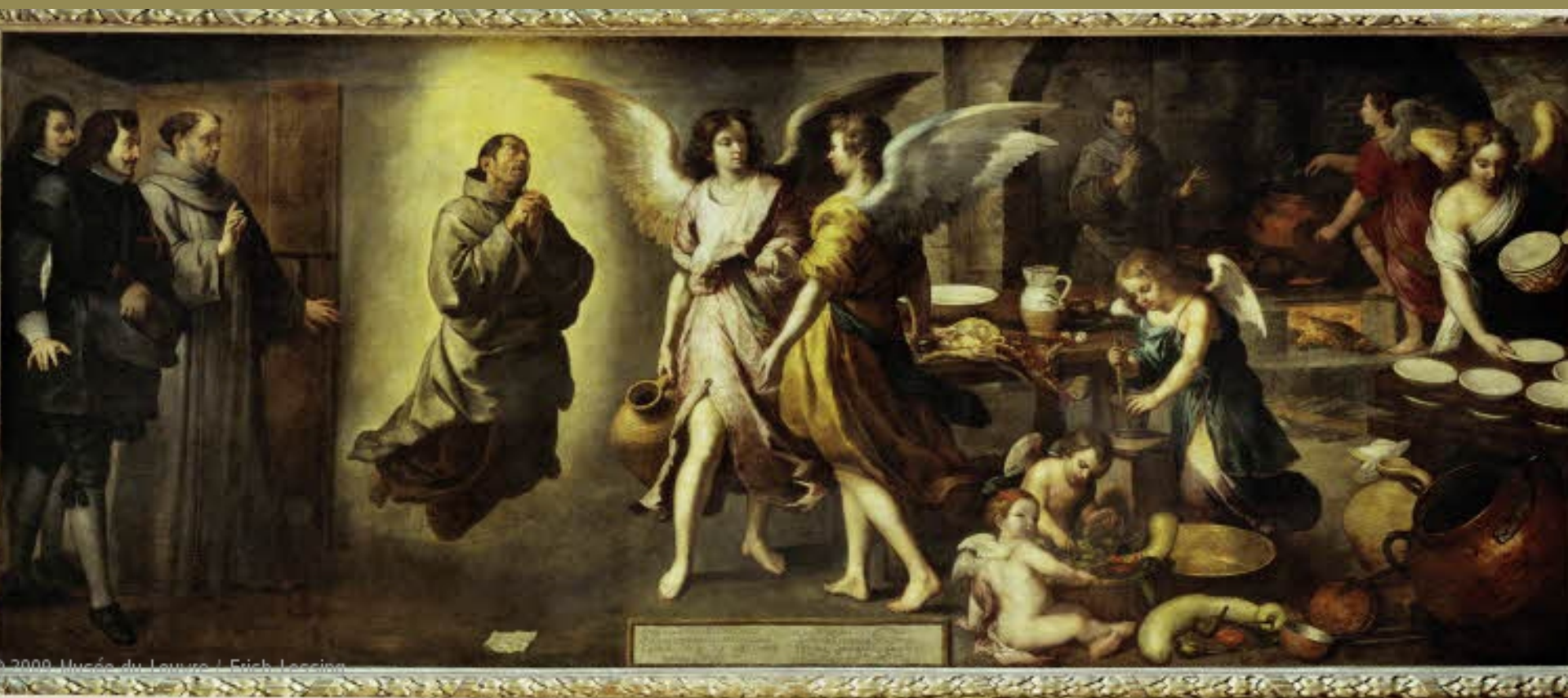
Bartolomé Esteban Murillo (Séville, 1618 – Séville, 1682), Le Miracle de frère Francisco, dit « La Cuisine des anges », 1646, peinture à l'huile sur toile, Paris, musée du Louvre.