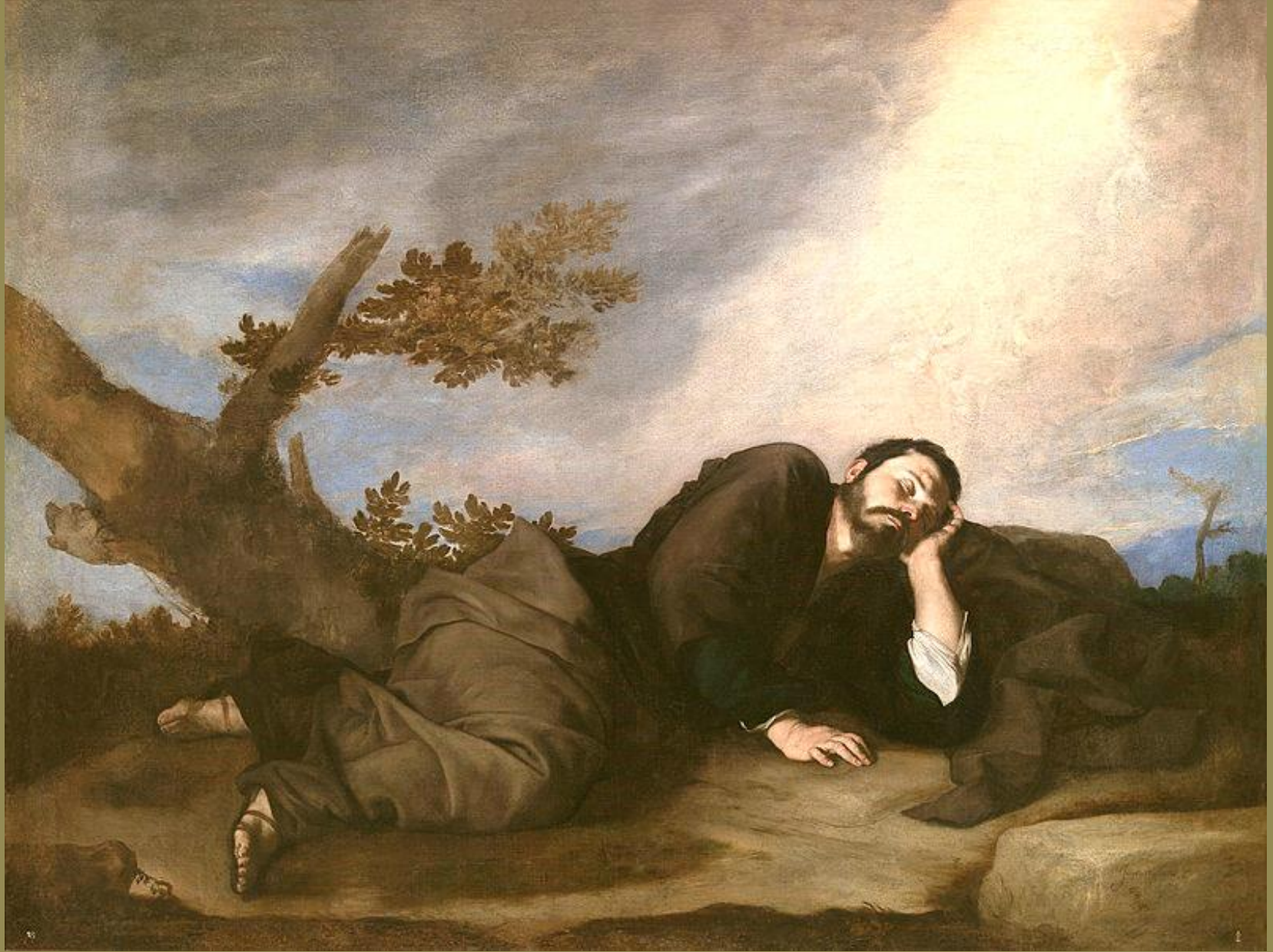
Jusepe de Ribera (Jativa, 1591 – Valence, 1652), Le Songe de Jacob , 1639, peinture à l'huile sur toile, Madrid, musée du Prado.