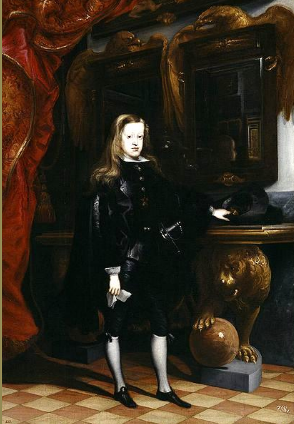
Juan Carreno de Miranda (Avilès, 1614 – Madrid, 1685), Charles II , vers 1675, peinture à l'huile sur toile, Madrid, musée du Prado.