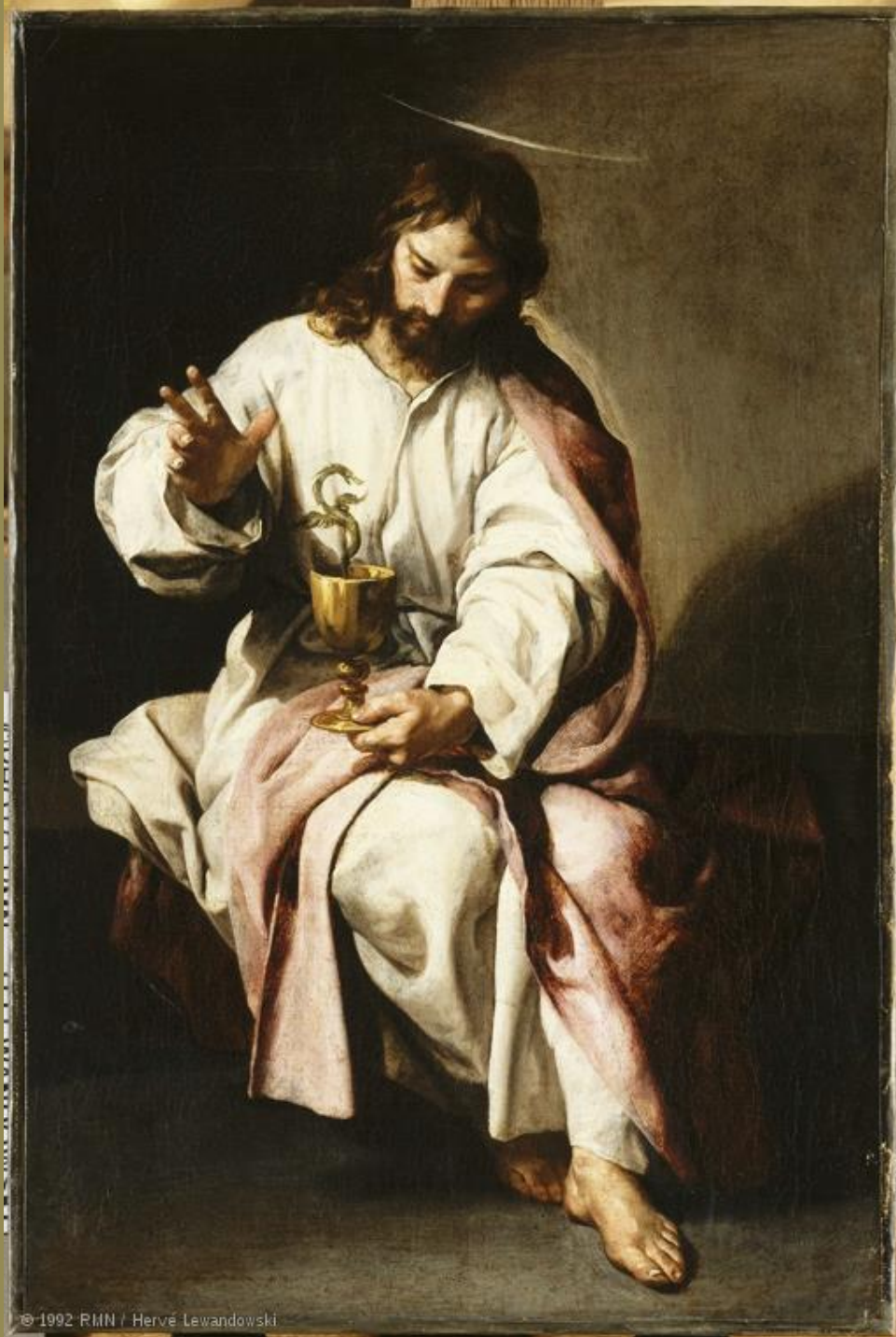
Alonso Cano (Grenade, 1601 – Grenade, 1667), Le Saint Jean l'Évangéliste, vers 1635/7, peinture à l'huile sur toile, Madrid, Academia de San Fernando.